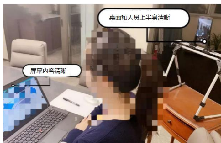
图 1 监控画面示意图

参赛选手上半身，桌面及电脑屏幕需全程完全清晰呈现在网上监考人员可见画面中，参赛选手全程不得切换屏幕；采用设备自带麦克风，不得佩戴耳机（包括有线、头戴式、蓝牙等耳机）。监控画面如图 1 和图 2 所示。