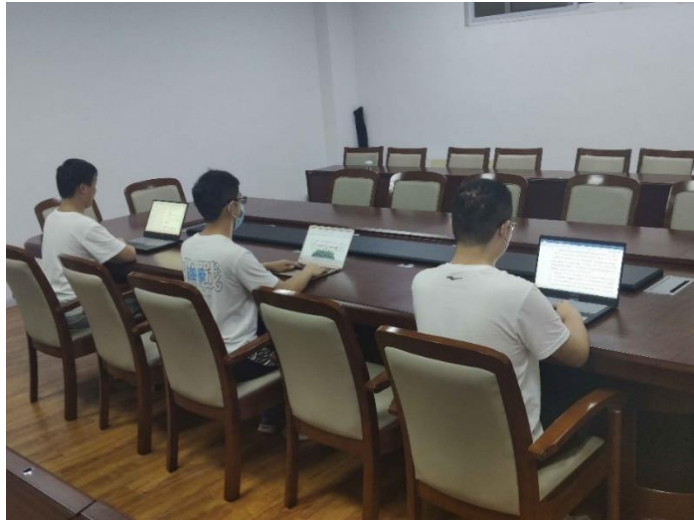
图 2 效果图（需拍全多人的画面，且能看清楚参赛者的电脑屏幕）